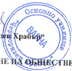
ГРАФИК ЗА ПРОВЕЖДАНЕ НА ОБЩЕСТВЕНИ ПОРЪЧКИ – 2017 ГОДИНА